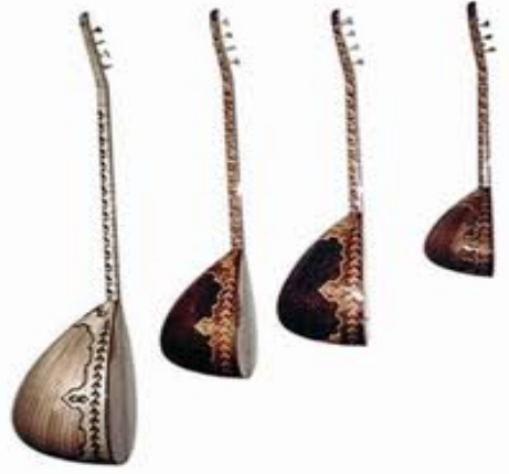
Resim 1. Divan Sazı Bağlama Tanbura Cura

Bağlama ailesine şekil ve yapı itibariyle baktığımızda, farklı boylardan, farklı sayıda tellerden ve farklı akortla aralarında boy ve ses rengi bakımından çok çeşidi olan aynı çalgıyı görmekteyiz. Ülkemizde, telli çalgılara Saz denilmesine rağmen, halk arasında bağlama çalgısına Saz’da denilmektedir. “Bağlama ailesi başlıca şu sazlardan oluşmaktadır; Meydan Sazı, Divan Sazı, Çöğür, Bağlama, Bozuk, Aşık Sazı, Kara Düzen Tanbura, Cura Bağlama, Bulgari, Irızva, Bağlama Curası ve Tanbura Curası v.s.” (Açın, 1994, s. 89).