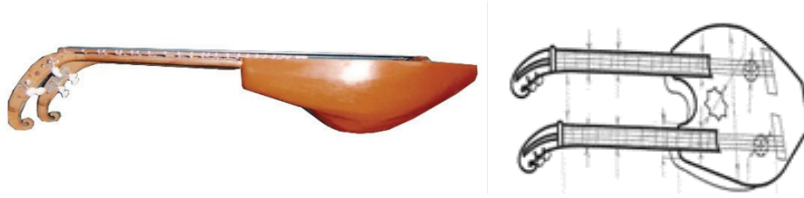
Resim 8. Sevgililer

Adını taşıyan bu müzik aleti bir çanak ve iki sap içerir. Aletin tamamı meşe ağacından yapılmıştır. "Sevgililer" hem akustik gitar hem de akustik ud benzeri bir tınıya sahiptir. Ayrıca elektronik ses için de çalışmalar yapılmıştır. Görünüş olarak hem ön hem de arka tarafta insana benzer bir şekil algılanabilir. "Sevgililer" enstrümanının çanağının uzunluğu 450 mm, genişliği 370 mm ve yüksekliği 175 mm'dir. Köprüden kafaya doğru mesafe ise 650 mm'dir. Aletin her sapında 4 tel ve 4 aşık vardır. Her sapın ses aralığı 3,5 oktavdır.