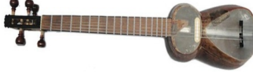
Resim 2. Akkord Tar

Çanağı dut ağacından, sapı, aşıklara ve kafası ise ceviz ağacından yapılmıştır. Kafa üstü, çanak üstü, köprü ve mızrap ise ebanittendir. Çanak kaplaması dana kalbi zarından yapılmış, sap üstü köprü ise kemikten yapılmıştır. Enstrüman, hem akustik hem de elektronik olarak çalınabilir. Enstrümanın çanağının uzunluğu 290 mm, sapının uzunluğu ise 4263 mm'dir. Büyük çanağın uzunluğu 185 mm, ağız genişliği 150 mm, küçük çanağın uzunluğu 105 mm ve ağız genişliği 133 mm'dir. Enstrümanın menzurası ise 6663 mm'dir. "Akkord Tar", altı telden oluşur. 4 oktav aralığı kapsar.