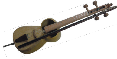
Resim 11. Yaylılar

4 tel ve 4 aşıktan oluşur. "Yaylı Tar", ses aralığı 3 oktav olan bas sesli bir enstrümandır. Bu alet, yayla çalınan enstrüman ailesine aittir. Müzik aletinin çanağı, tar müzik aletinin çanağına benzer. Enstrümanın menzurası, geliştirilmiş bas kamança menzurasına eşittir. Yaylı Tar'ın büyük çanağının üzerine keçi derisi çekilmiştir. Küçük çanak ise açık kalmıştır. Bu, çanak içi seslerin serbestçe dolaşmasını sağlar.