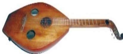
Resim 4. Udmen

Bu enstrüman dört tellidir ve tınısı ud enstrümanına yakındır. Sapı, çanağın üst kabuğu ve kafası meşe ağacından, çanağın arka kısmı ise fıstık ağacından yapılmıştır. Ayrıca klasik ud enstrümanından farklı olarak burada perdeler yerleştirilmiştir. "Udmen"de icracının rahat çalabilmesi için perdeler planka üzerine sarılır. Enstrümanda hem akustik hem de elektronik tını elde edilmiştir. "Udmen"nin telleri köprüye sabitlenmiştir. Enstrümanın çanağının uzunluğu 435 mm, yüksekliği 140 mm'dir. Menzurası ise 586 mm'dir. "Udmen"nin ses aralığı 3 oktavidir.