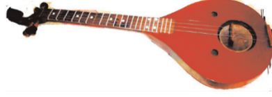
Resim 5. Selyani

Enstrüman iki odadan oluşur. Birinci oda aşağıda, ikinci oda ise yukarıda yer alır. Köprü, birinci odanın üst dekasının üzerine yerleştirilir. Birinci odanın üst dekasında çapı 8 mm olan çok sayıda delik açılmıştır, böylece ses dalgaları her iki çanakta rahatlıkla hareket edebilir. Bu da enstrümanın kendine özgü tınısının oluşmasına neden olur. Enstrümanın çanağının uzunluğu 350 mm, genişliği 273 mm, yüksekliği ise 103 mm'dir. Sapın uzunluğu 430 mm, menzurası ise 590 mm'dir. Enstrümanın ses aralığı 3 oktava kadar çıkar ve 4 teli vardır.