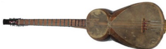
Resim 1. Kontr Tar

Çanağı dut ağacından, sapı ise ceviz ağacından yapılmıştır. Aşıklara mekanik olarak ayarlanır. Büyük çanağın genişliği 2756 mm, küçük çanağın genişliği ise 2414 mm'dir. Çanağın yüksekliği 215 mm'dir. Enstrümanın menzurası 860 mm'dir. Kafanın uzunluğu 150 mm, yüksekliği 115 mm ve genişliği ise 44 mm'dir. Sapın çanak kısmındaki genişliği 50 mm ve sap kısmındaki genişliği ise 42 mm'dir. Büyük çanağın uzunluğu 248 mm, küçük çanağın uzunluğu 141 mm'dir. 3 oktav ses aralığına sahiptir. 4 tel ve 4 aşıktan oluşur.