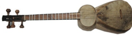
Resim 3. Bem Tar

Kendine özgü özelliklerle ayırt edilir. Enstrümanın orijinal bir tınısı vardır. "Bem Tar"ın çanağının uzunluğu 320 mm, yüksekliği 165 mm ve çanağın genişliği 220 mm'dir. Büyük çanağın uzunluğu 200 mm ve küçük çanağın uzunluğu 120 mm'dir. Sapın uzunluğu 460 mm, kafanın uzunluğu 130 mm ve kafanın yüksekliği 100 mm'dir. Çanak dut ağacından, kafa, sap ve aşıklara ise ceviz ağacından yapılmıştır. "Bem Tar"da 4 aşık ve 4 tel vardır. Ses aralığı 3 oktava eşittir.