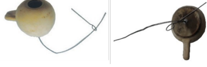
Resim 12. Şimşek

Aletin oluşturulmasına Tahran'da karşılaştığımız benzer bir alet vesile oldu. Aletin kendine özgü gök gürültüsünü andıran bir tınısı var. Bu nedenle aleti "şimşek" olarak adlandırdık.