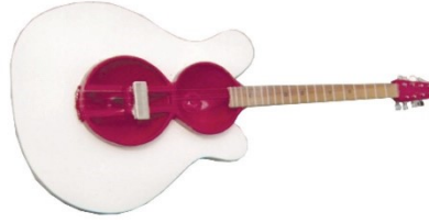
Resim 6. Azerbaycan

İki büyük ve küçük içlikten oluşur. Enstrümanın sapı ve kafası fıstık ağacından, diğer kısımları ise kontrplak malzemeden yapılmıştır. Bu parçalar da metal içlikleri tutmak ve icracı için rahatlık sağlamak içindir. Perdeler, mugam perdelerine uygundur ve plinkada yer alır. Bu da tüm mugamların icrasını mümkün kılar. "Azerbaycan"ın çanağının uzunluğu 465 mm, genişliği çanağın alt kısmında 400 mm, sapa yakın kısmında ise 245 mm'dir. Menzurası 650 mm'dir. Enstrümanın dört teli vardır ve 4 oktav ses aralığına sahiptir.