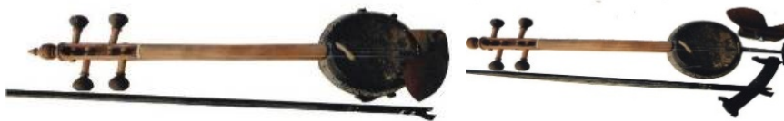
Resim 9. Karabağ Kemani

Tamamen fıstık ağacından yapılmıştır. Enstrümanın en üstün özelliklerinden biri hem kemeñçe hem de keman gibi çalınmasıdır. Bu enstrüman, kemeñçe akoruna göre akorlanır. Çanağın üst çapı 13 cm, çanağın kendi çapı 167 cm'dir. Kafadaki köprüden çanağın üzerindeki köprüye kadar olan mesafe 315 cm'dir. Karabağ Kemani'nin ses aralığı 3 oktavdır.