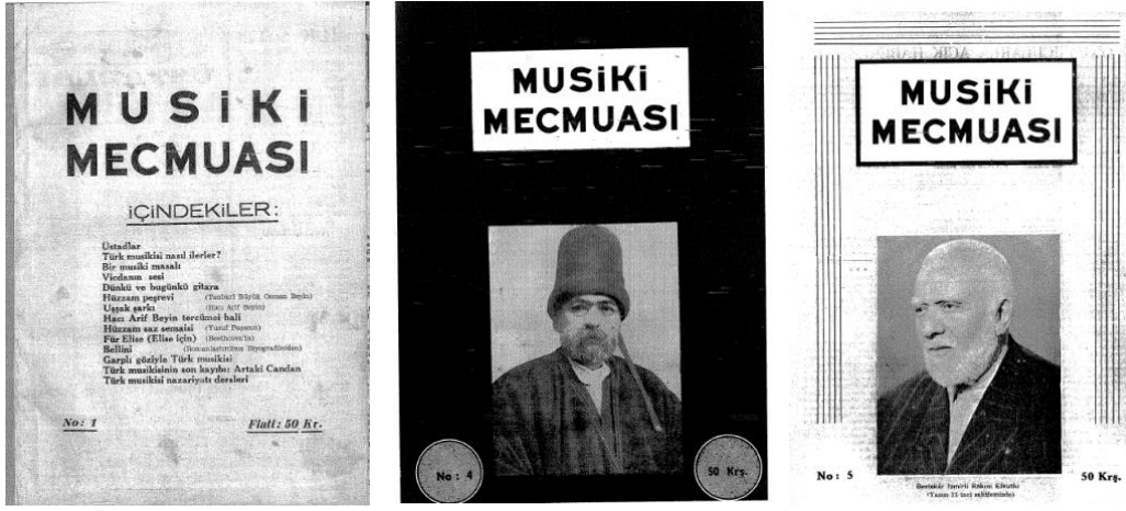
Fotoğraf 2. Musiki Mecmuası (Çelik, arşiv, 1Mart, 1Haziran, 1Temmuz, 1948-sayı:1.4.5)

Bibliyografya çalışmaları, ait olduğu bilim dalının vazgeçilmez kaynaklarıdır. Farklı akademik yayınlarda, belirli konularda hatta belli bir yazara ait çalışmaların bir araya getirilerek, içeriklerinin belirli ipuçları aracılığı ile düzenlendiği bu çalışmalar, bilgiye ulaşma konusunda rehberlik yaparak, araştırmacının yolunu aydınlatır. Bu tür çalışmalar araştırmacılara yeni fikirler vererek zaman kazandırır (Tuna, 2017:126)